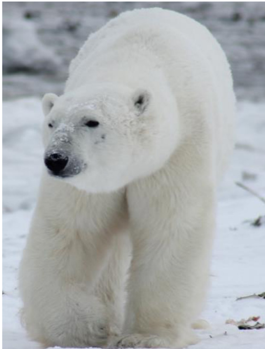
Abb. 5: Eisbär in seinem Habitat (SEQ)

Eisbären ( Ursus maritimus ) sind die zweitgrößte Bärenrasse der Welt. Neben ihrem weißen Fell sind sie an einer Vielzahl weiterer Merkmale, etwa den großen Tatzen, die ihnen sowohl beim Schwimmen als auch bei der Fortbewegung im Schnee helfen, zu erkennen